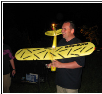
Modellflieger beim Nachtfliegen

Neben den „großen“ Fliegern laden wir auch wieder alle Modellflieger zu uns ein. Und wer noch