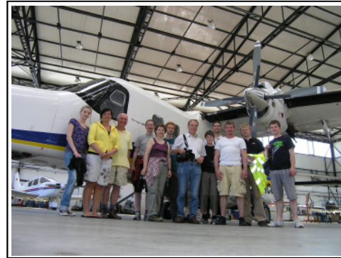
Teilnehmer beim Besuch eines Luftfahrtunternehmens

Fliegen steht natürlich im Mittelpunkt der Freizeit, und so erwarten wir wieder die unterschiedlichsten Fluggeräte. Vom Segelflieger über Ultraleicht und Motorflugzeugen bis hin zu Tragschraubern freuen wir uns auf eine interessante Mischung.