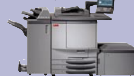
Neue digitale Druckmaschinengeneration.

Wie Sie seit einem Jahr feststellen können, hat diese Zeitung verschiedene grafische Stadien durchgemacht. Die erste Anpassung fand aufgrund des Grafikerwechsels statt. Die nächste Anpassung musste schnellstens ausgeführt werden, um die aufwändige dreifache Faltung zu verhindern und schlussendlich die heutige Anpassung, die den Anforderungen der neuen digitalen Druckmaschinen der Druckerei entsprechen.