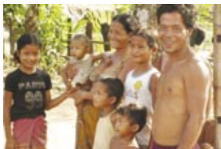
Familie aus dem Kavett Stamm im Norden Kambodschas

Wir danken Gott, der uns die Kraft gibt jeden Tag mit Freuden diese Arbeit auszuführen.